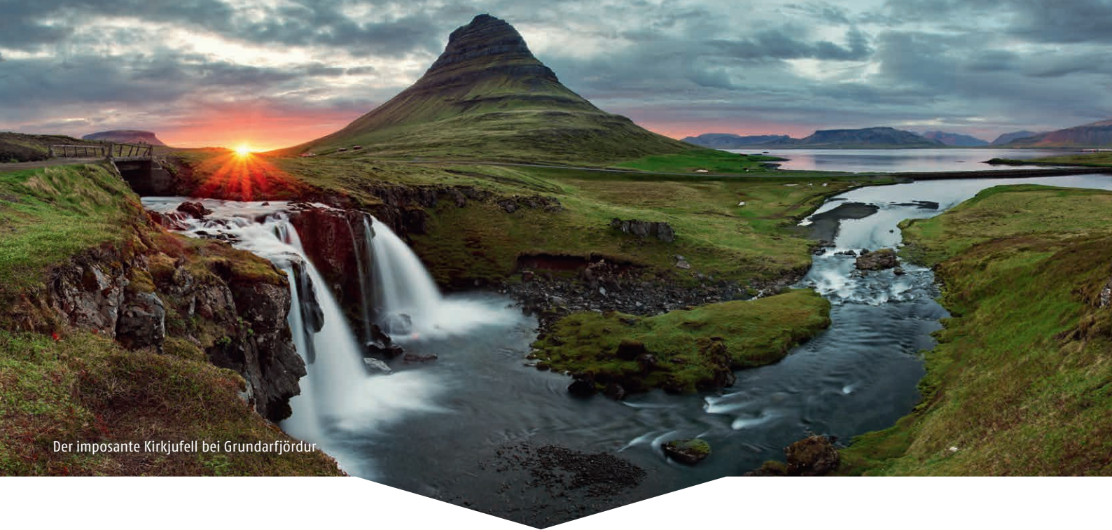
Der imposante Kirkjufell bei Grundarfjörður